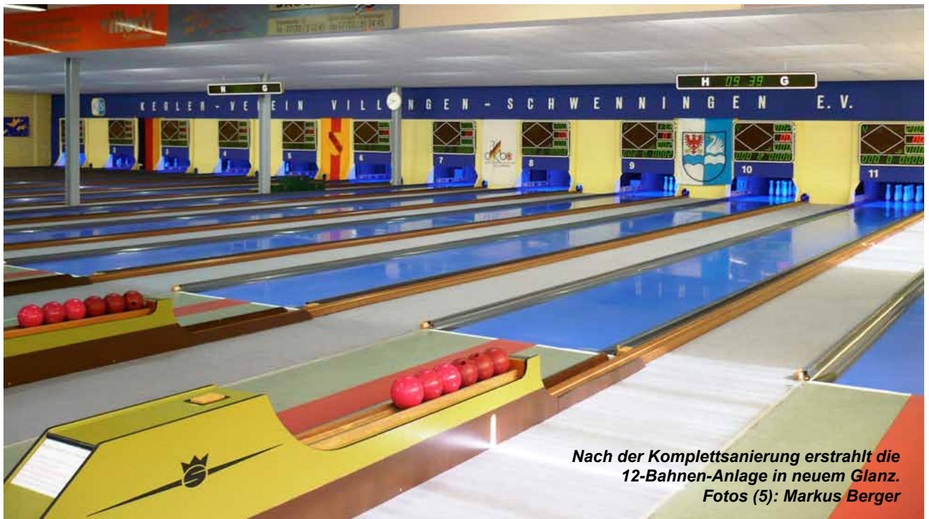
Nach der Komplettanierung erstrahlt die 12-Bahnen-Anlage in neuem Glanz.

Erster nationaler Höhepunkt in Villingen-Schwenningen