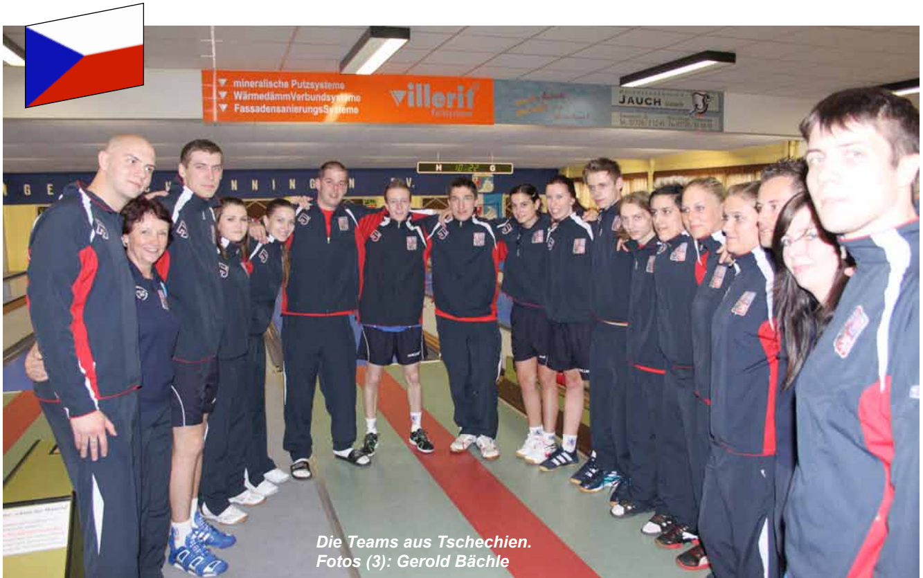
Die Teams aus Tschechien.