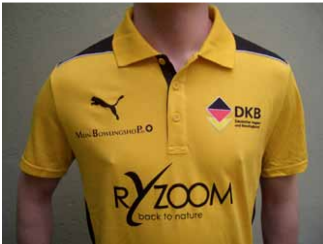
Der neue Dress des DKB: In den Polo-Shirts gehen Deutschlands Nationalbowlerinnen und -bowler auf die Bahnen,...