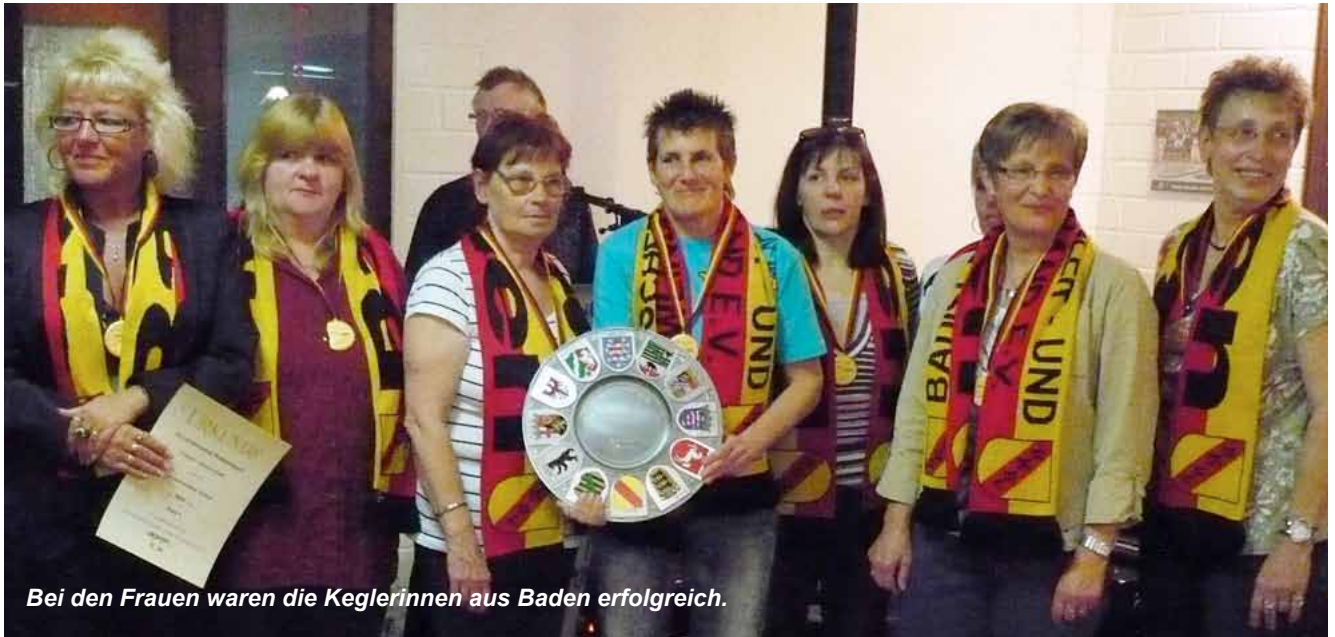
Bei den Frauen waren die Keglerinnen aus Baden erfolgreich.