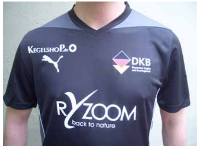
...in den Trikots mit V-Ausschnitt die Kegelsportlerinnen und -sportler der Disziplinen Bohle, Classic und Schere.

Wolltest Du nicht Deine Kollegin zum nächsten Training mitnehmen?