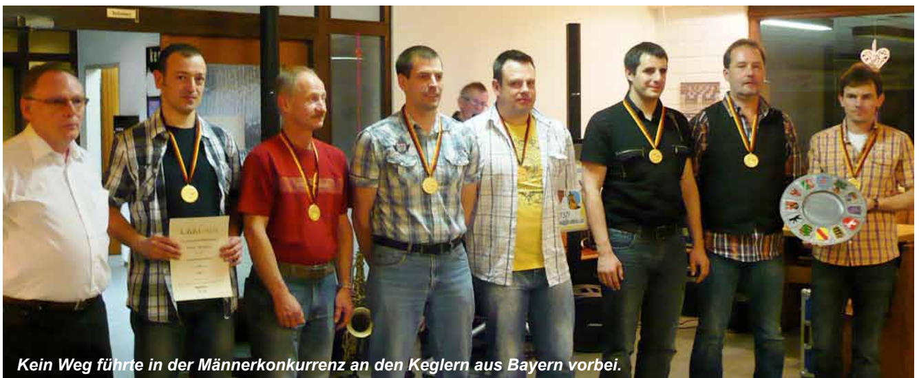
Kein Weg führte in der Männerkonkurrenz an den Keglern aus Bayern vorbei.